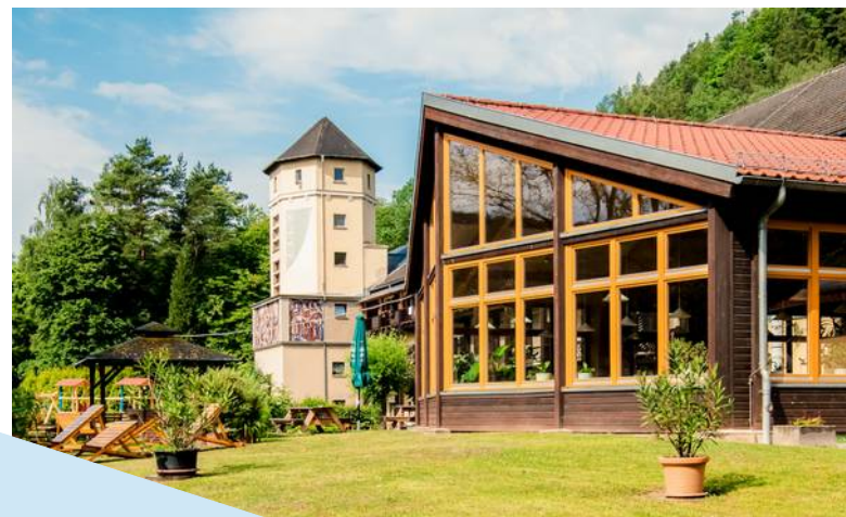
Aktivhotel „Stock & Stein“